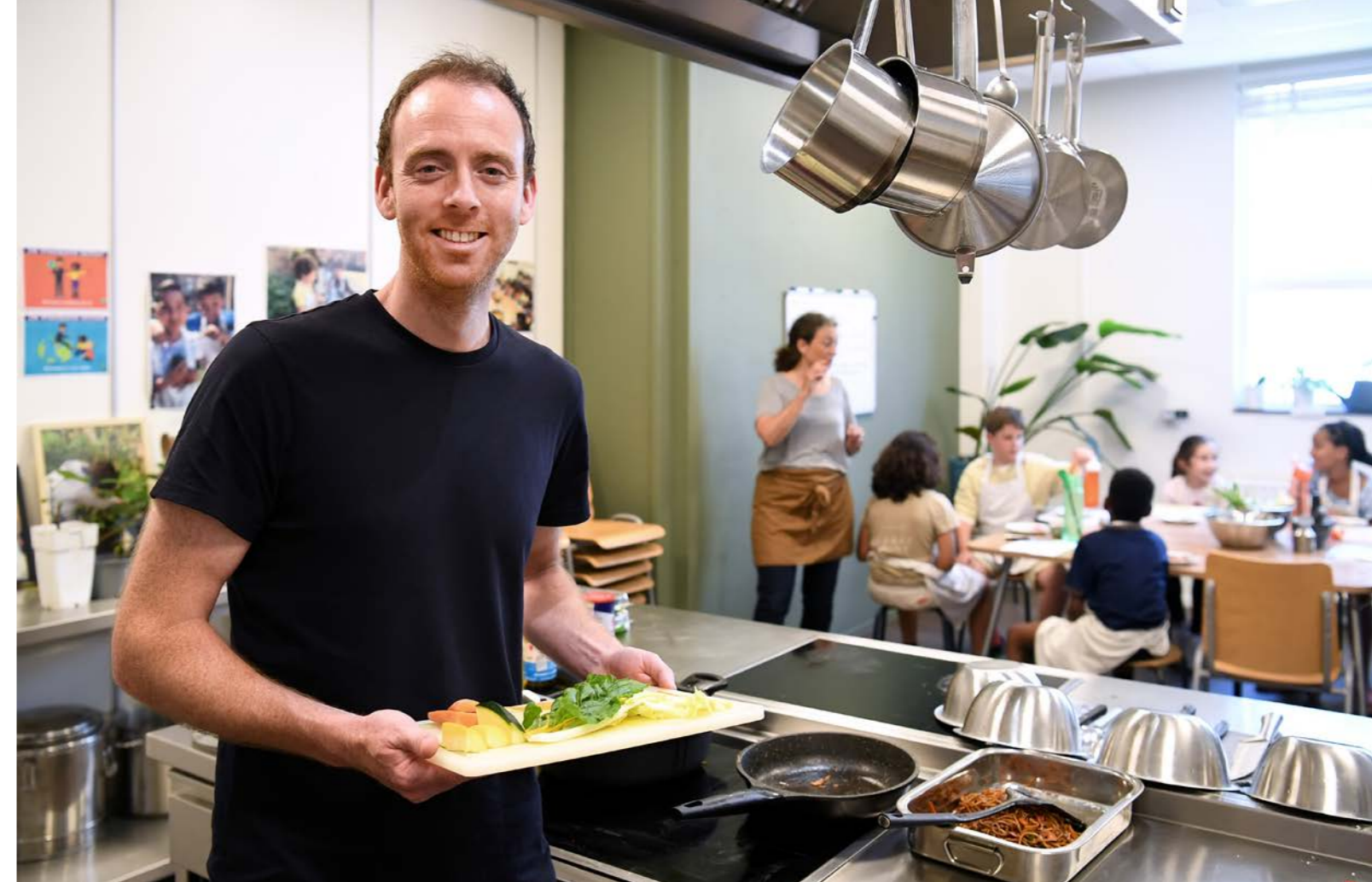
Een impressie van de ‘Ouders ontmoeten Ouders’ bijeenkomsten op de Indische Buurtschool